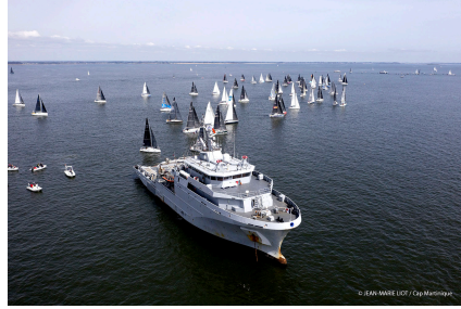
HD disponibles sur demande.